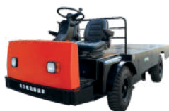
BD1/5 Tone Baterie Acid/Li-ION