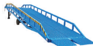
Rampe Mobile 8-15 tone