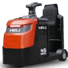
3 / 4.5 tone Baterie LI-ION 48V/120Ah