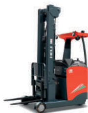
CQD1.5/1.8 Tone Baterie 48V / 345(360)Ah