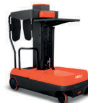
Order picker OPMS Baterie 24V / 105(250)Ah