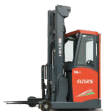
CQD1.4/1.6/20 tone Baterie 48V / 450(560)Ah Baterie LI-ION 48V/404Ah