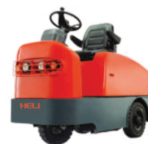
CQD1.5/2/3/4/5/6 tone Baterie 24V / 280Ah