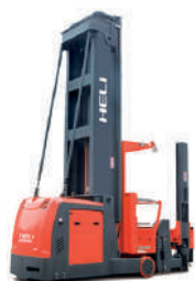
OPDS 1.5 tone Baterie 80V / 560Ah