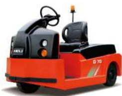
CYD5/6/10 tone Baterie 48V / 380(520)Ah