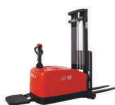
CDD03/12/16 Contrabalansată SERVODIRECȚIE

Baterie 24V / 210-280Ah Baterie LI-ION 24V / 150Ah