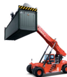
REACH-STAKER 45 tone Motoare VOLVO