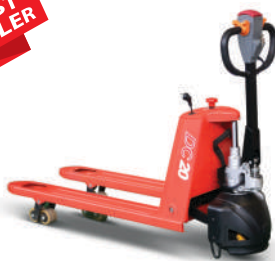
CBD20J-B - SEMIELECTRICĂ