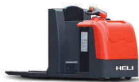
JX12J Baterie 24V-360Ah